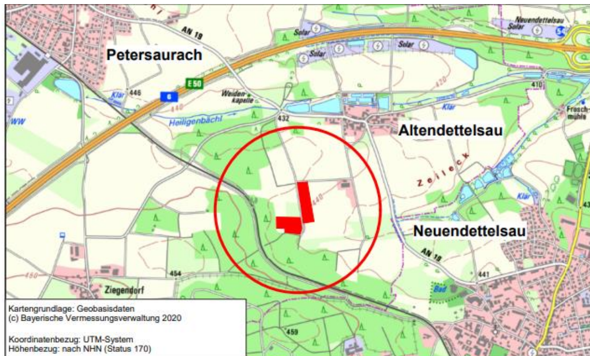
Rot dargestellt: geplante Änderungsbereiche des Flächennutzungsplans der Gemeinde Petersaurach © Karte Bay. Vermessungsverwaltung 2022