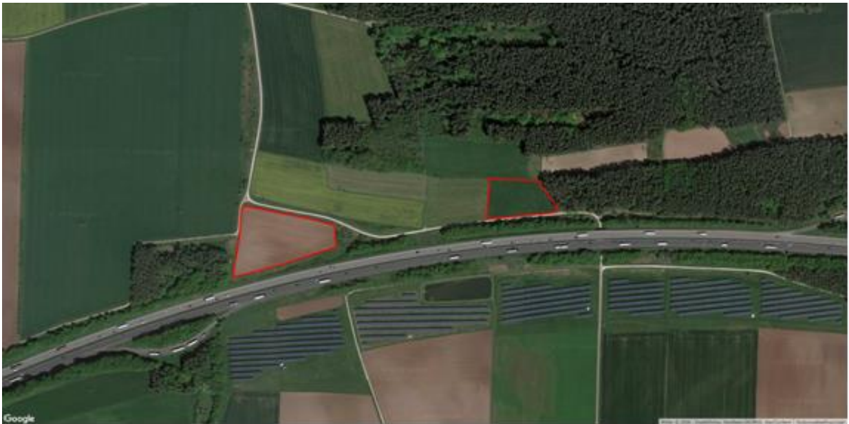
Abbildung 1: Planungsgebiet