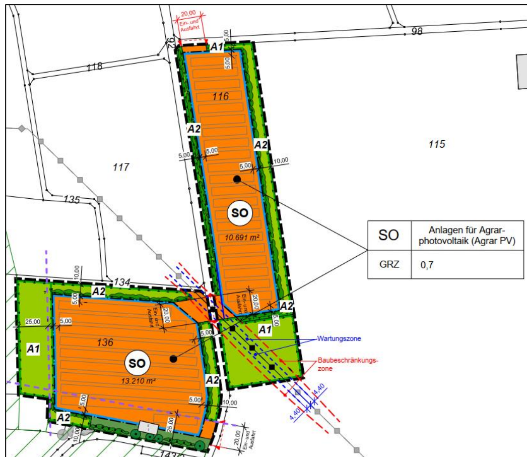
Auszug aus dem Planblatt ohne Maßstab

Grafisch stellen sich die Planungsabsichten wie untenstehend verkleinert ohne Maßstab abgebildet dar: